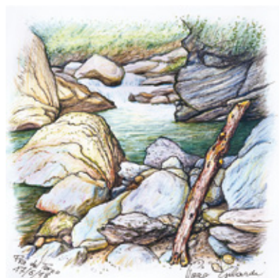
Piero Gilardi, some drawings currently exhibited at CollAge - Collection Storage, Todi.