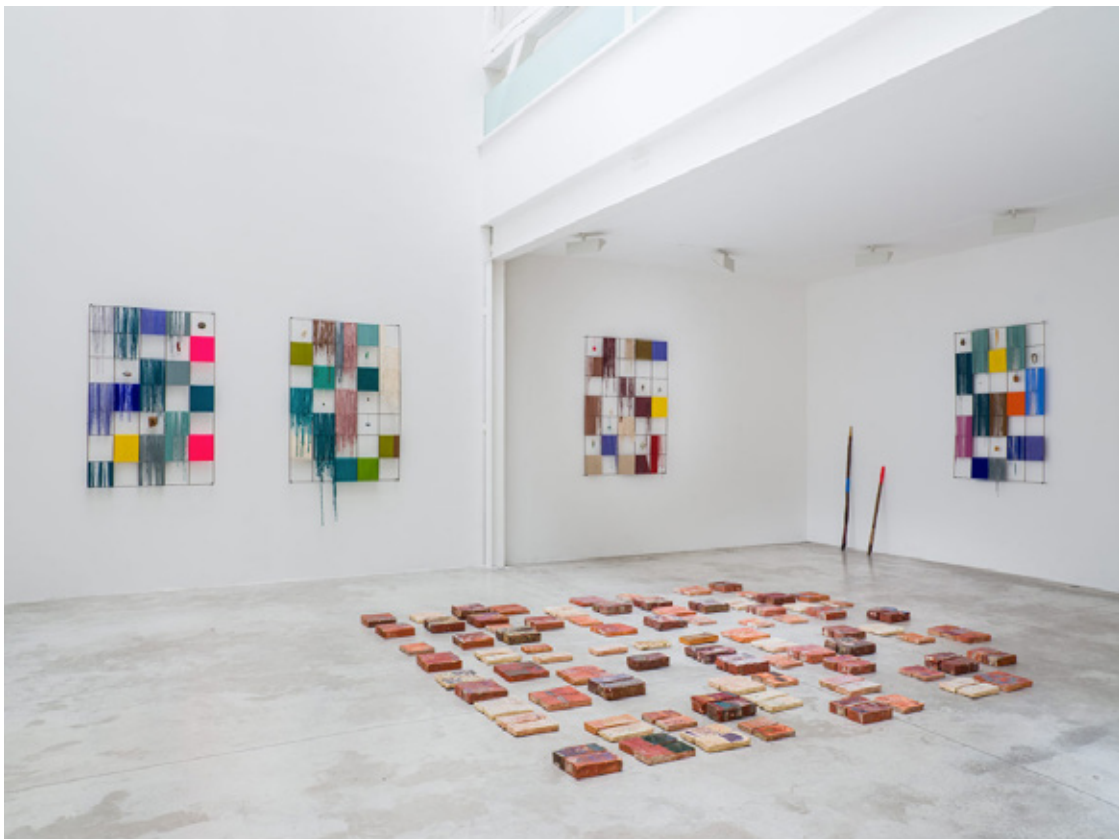
"The Library of encoded time", 2019. Vista de la instalación, Michel Rein, Paris-Bruselas.