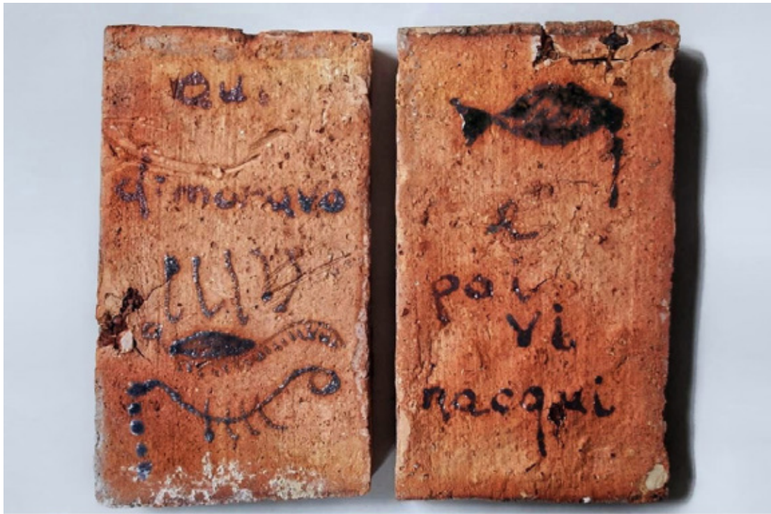
"The library of encoded time" (detalle), 2019. Esmalte sobre ladrillos antiguos. 2 × 16 × 9 cm cada uno.