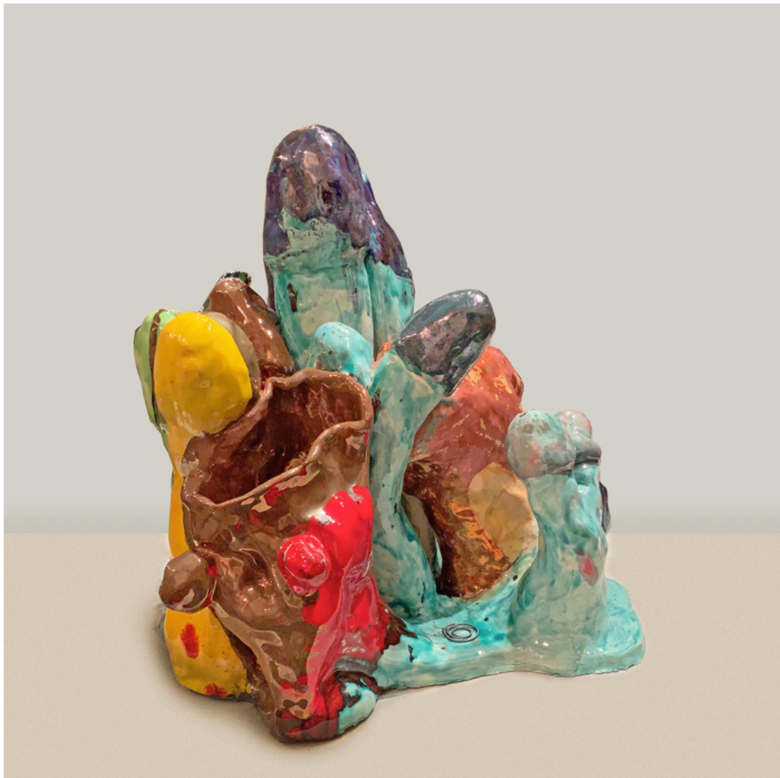
"Hot Crew", 2019. Cerámica con esmaltes y lustres. 30 x 30 x 34 cm.