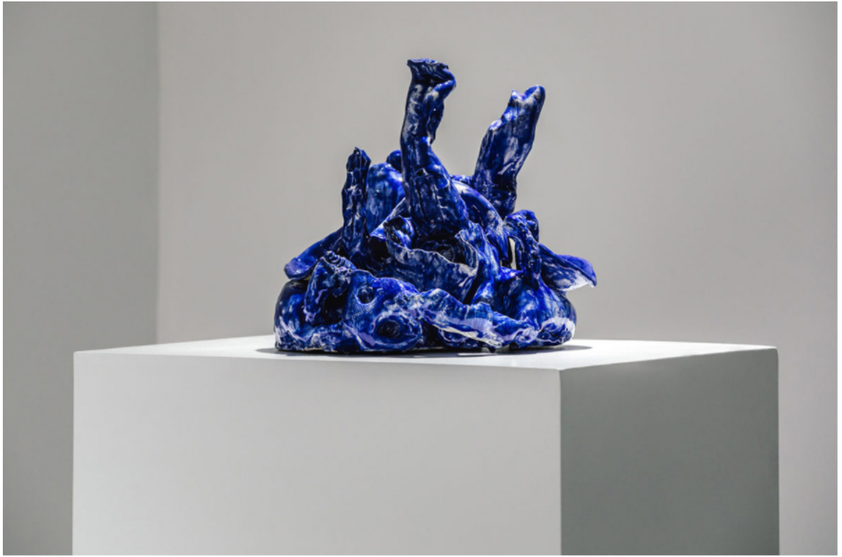
"Earth Island #4", 2019. Cerámica esmaltada. 37 x 37 x 39 cm.