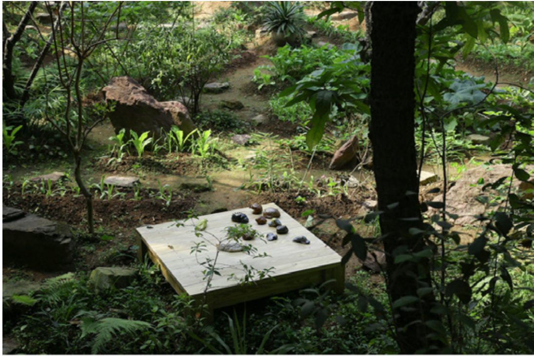
"Sweet concretion", 2014-2018. Detalle de la instalación. Mirrored Gardens – Vitamin Creative Space, Guangzhou.