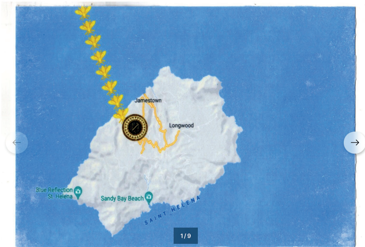
Luca Vitone Pro tempore (cartoline) 2021/9 cartoline, 14,8 x 21 cm ognuna

Locuzione latina usata per indicare qualcosa di temporaneo, pro tempore si fa portavoce di incarichi di responsabilità dalla durata limitata. Una dimensione temporale che l'artista Luca Vitone (Genova, 1964) ha deciso di indagare con il progetto omonimo, approfondendo il tema del potere nella contemporaneità, recuperando la figura di Napoleone Bonaparte e il mare, inteso come metafora.