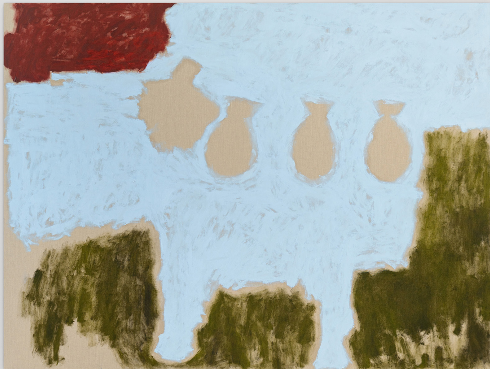
à gauche : Bombing Giverny , 2023, huile sur toile, 155 x 205 cm. à droite : Pacifique , 2024, bronze patiné, 920 x 65 x 65 cm, Le Havre, France.