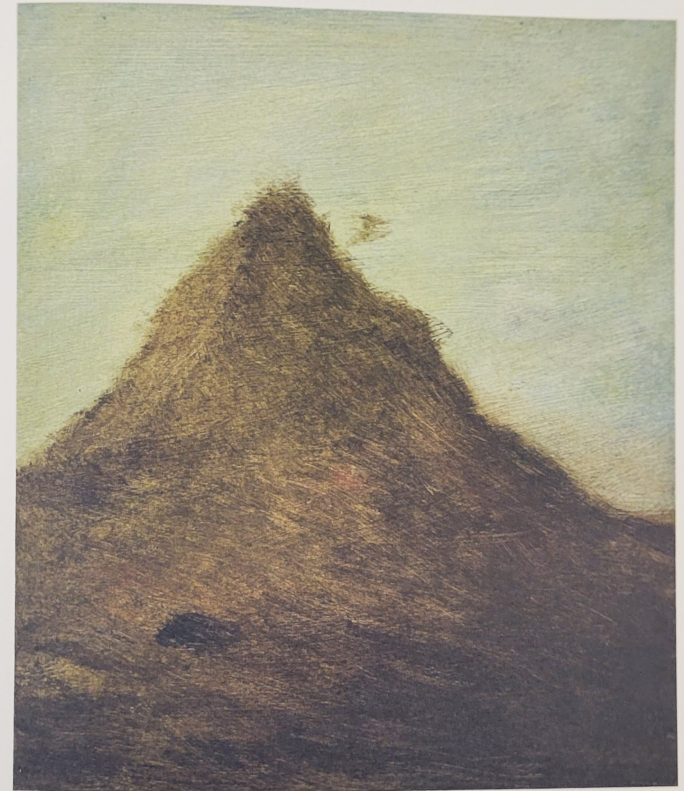
à gauche : Tariverdiev , 2024, chêne, pierre Daté Kan, cerisier du Japon, huile d'olive, 166 x 44 x 43 cm. à droite : Variation sur le motif de montagne , 2023, huile sur bois, 30 x 25 cm.