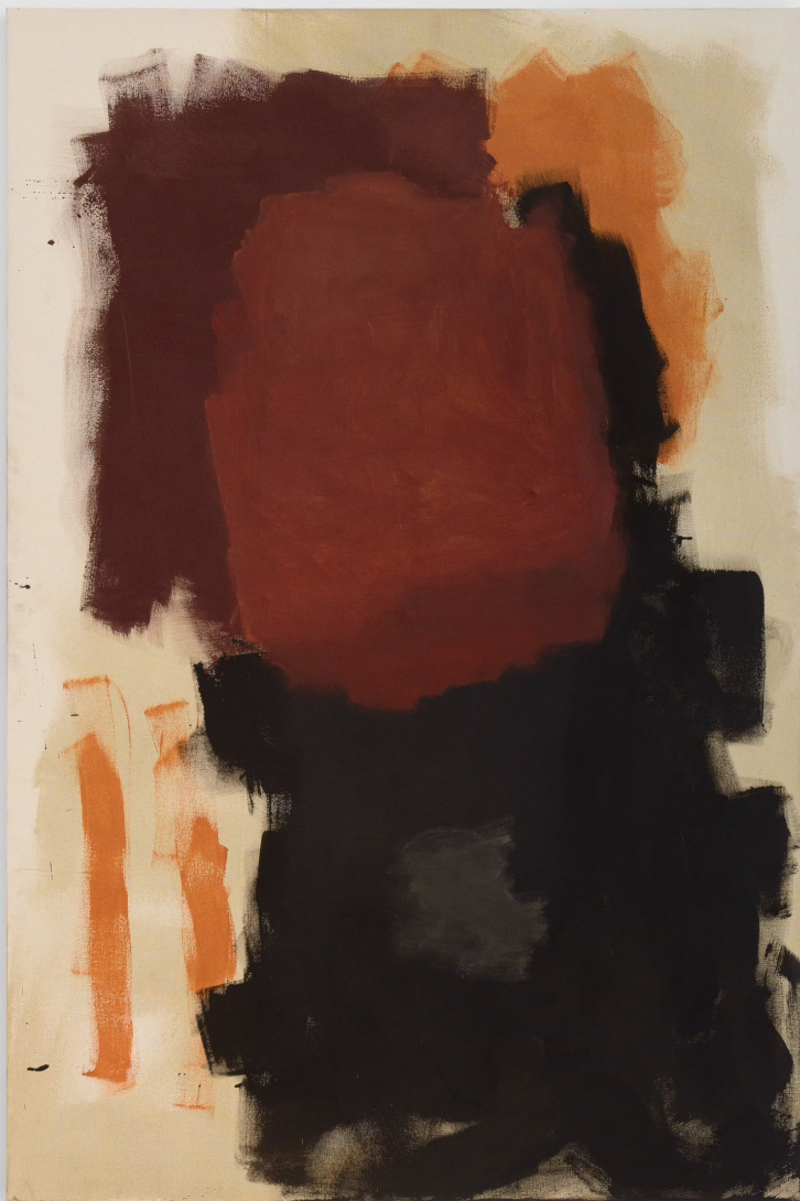
à gauche : Sans titre (Razzle Dazzle) , 2023, pigment sur toile, 180 x 120 cm.