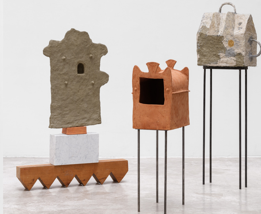
à droite : Post Arato-san , 2024, argile paille, céramique, marbre de Carrare, chêne, huile d'olive, 136 x 98 cm; Petit Sarcophage , 2024, céramique, acier, 110 X 64 cm; Post Aralo-san , 2024, argile, paille, acier, bambou, 160 x 64 cm.