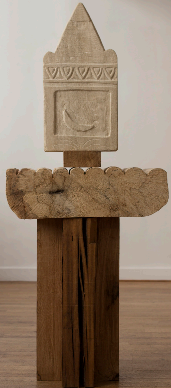
à gauche : Monument , 2022, pierre "Yvoir", bois de chêne, pavé, céramique, pigment, 130 x 22 x 19 cm. à droite : Nouvelle Lune , 2024, pierre de Creully, marronnier, chêne, 155 x 62 x 40 cm.