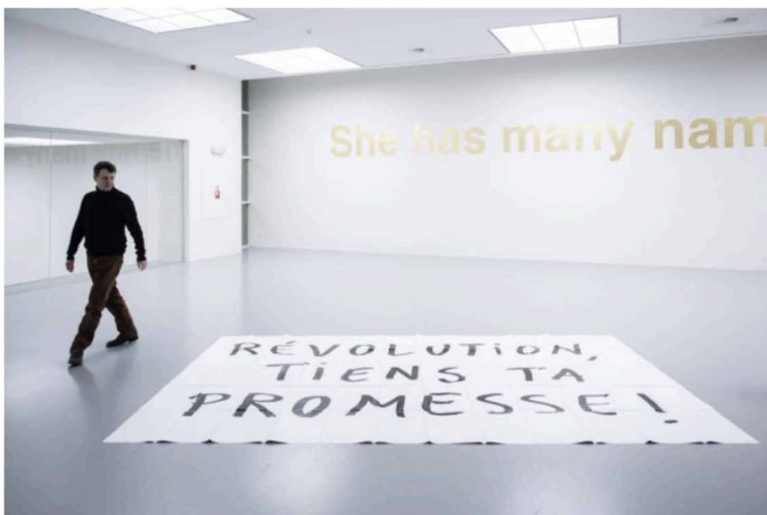
She has many names, Dora Garcia, M HKA, soirée d'ouverture.

Formée à la sculpture, Dora Garcia s'est lancée dans la performance quand elle résidait à Bruxelles. L'artiste espagnole se distingue de beaucoup d'autres performeurs en déléguant l'acte de la performance à d'autres et en proposant des performances qui ne cherchent pas une interaction directe avec le public mais plutôt à développer un narratif. Cette distance avec son œuvre permet de répéter la performance, mais aussi de la vendre à une institution ou à un musée qui en achète le protocole, c'est-à-dire une suite d'instructions précises qui peuvent éventuellement être adaptées par l'artiste en fonction de l'évolution technologique (téléphones ou ordinateurs, par exemple). Pour l'artiste, la performance est d'abord une réaction à l'idée du musée comme un espace neutre, le fameux white cube, en apportant des notions de présence, de durée ou de genre, avec cette idée que rien n'est permanent et que tout évolue.