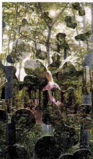
« LE JARDIN DU VERSTOHLLEN », À CHAUMONT-SUR-LOIRE.

« AGNÈS THURNAUER. ALIÉNOR L'OURAGANE », jusqu'au 16 juillet, musée d'Art moderne de Fontevraud (49).