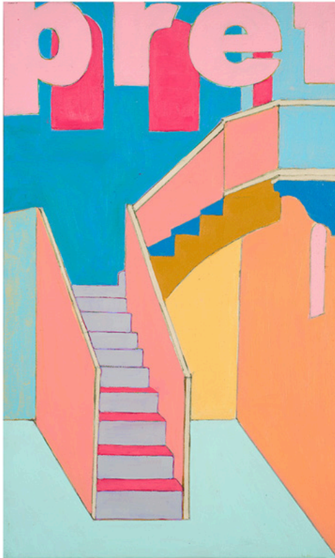
Agnès Thurnauer, Vue d'atelier