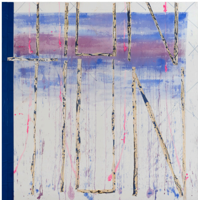
Agnès Thurnauer, Nuit Crédi

Superbe exposition que celle proposée par l'artiste contemporaine franco-suisse, qui crée des liens sensibles et singuliers entre l'écriture et la peinture. Passionnée de littérature, Agnès Thurnauer a écrit ici cinquante lettres adressées à Matisse entre avril 2021 et janvier 2022, sachant que le maître fauve a aussi travaillé de son temps à l'illustration de livres, partie de son œuvre encore assez méconnue. Dans cette exposition, Thurnauer aborde ainsi les thèmes de l'illustration et de l'édition, à savoir la réalisation d'œuvres reproductibles. A travers cet accrochage, elle vient nous rappeler que la peinture est déjà en soi un langage pictural, avec ses traits, ses formes, ses couleurs mais également sa composition, entre lignes horizontales et verticales. Une production réjouissante à découvrir.