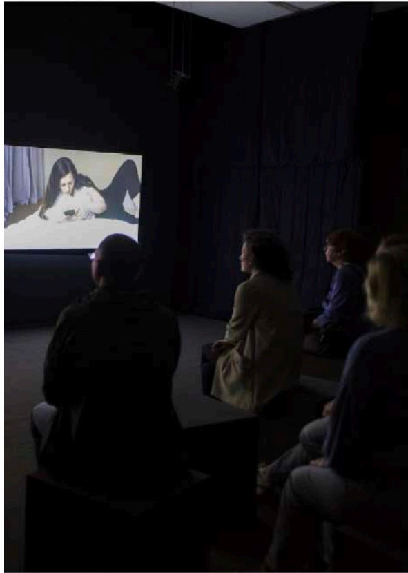
en, maar spreekt zelf niet."

Vorige zomer brandde een opslagplaats af waarin haar viltwerken lagen te wachten op een expo. Ze moest opeens nieuw werk creëren, terwijl ze zich eigenlijk al op MACS wou concentreren. Deze tentoonstelling werd dan weer opgeschoven, omdat de opening anders samenviel met de lammerijd. "In die periode kan ik de boerderij niet verlaten."