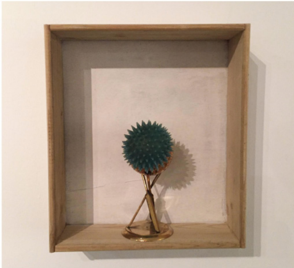
米凯拉·乔亚乔费拉 (Michele Ciacciofera) 作品