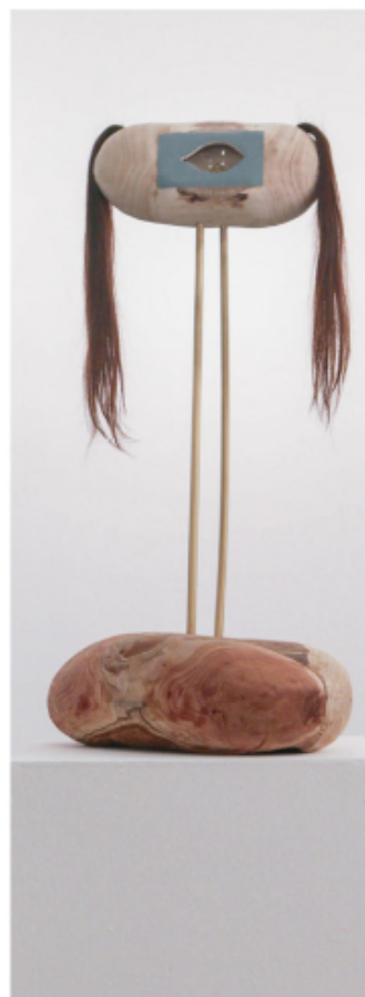
米凯拉·乔亚乔费拉 (Michele Ciacciofero) 作品

的理想形象）。这些都是建立在绘画、解构绘画的、显得十分偏执的过程中而创作出来的，我一步步，做了很多标记、修改符号，使一切作品都服从于我企图实现的记忆，并在重复出现的、与过去的意象、变形的意象相关的各种形式、标记、象征之中予以表达，与此同时，我也注意保留我原本的身份特征，允许不完美、各种至关重要的创造性的错误。作品中所呈现的人类的脆弱与无力会邀请观者，使他们有共鸣、并引发思考，在此过程中甚至寻找、并找到、重构他们的身份。