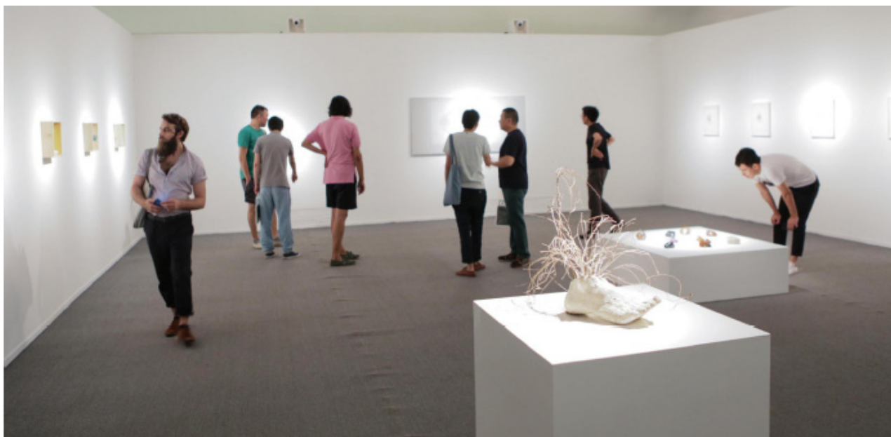
“重游自然之魂 (Enchanted Nature Revisited)” 展览现场