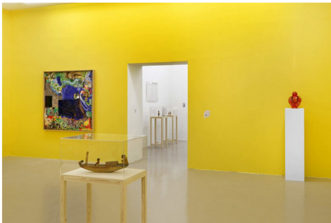
Vue de l'exposition « The Middle Earth – Projet Méditerranéen » de Maria Thereza Alves & Jimmie Durham

« Cette exposition est dédiée à ceux qui, en ce moment, rejoignent courageusement les frontières de l'Europe et aideront à construire le futur. » De la part de deux artistes autoproclamés « citoyens itinérants », cette dédicace souligne l'importance des migrations et du mouvement. Dans ce projet intitulé « The Middle Earth », chaque objet semble façonné par des siècles d'histoire(s), à l'image des migrations qui tirent des lignes invisibles sur la mer Méditerranée.