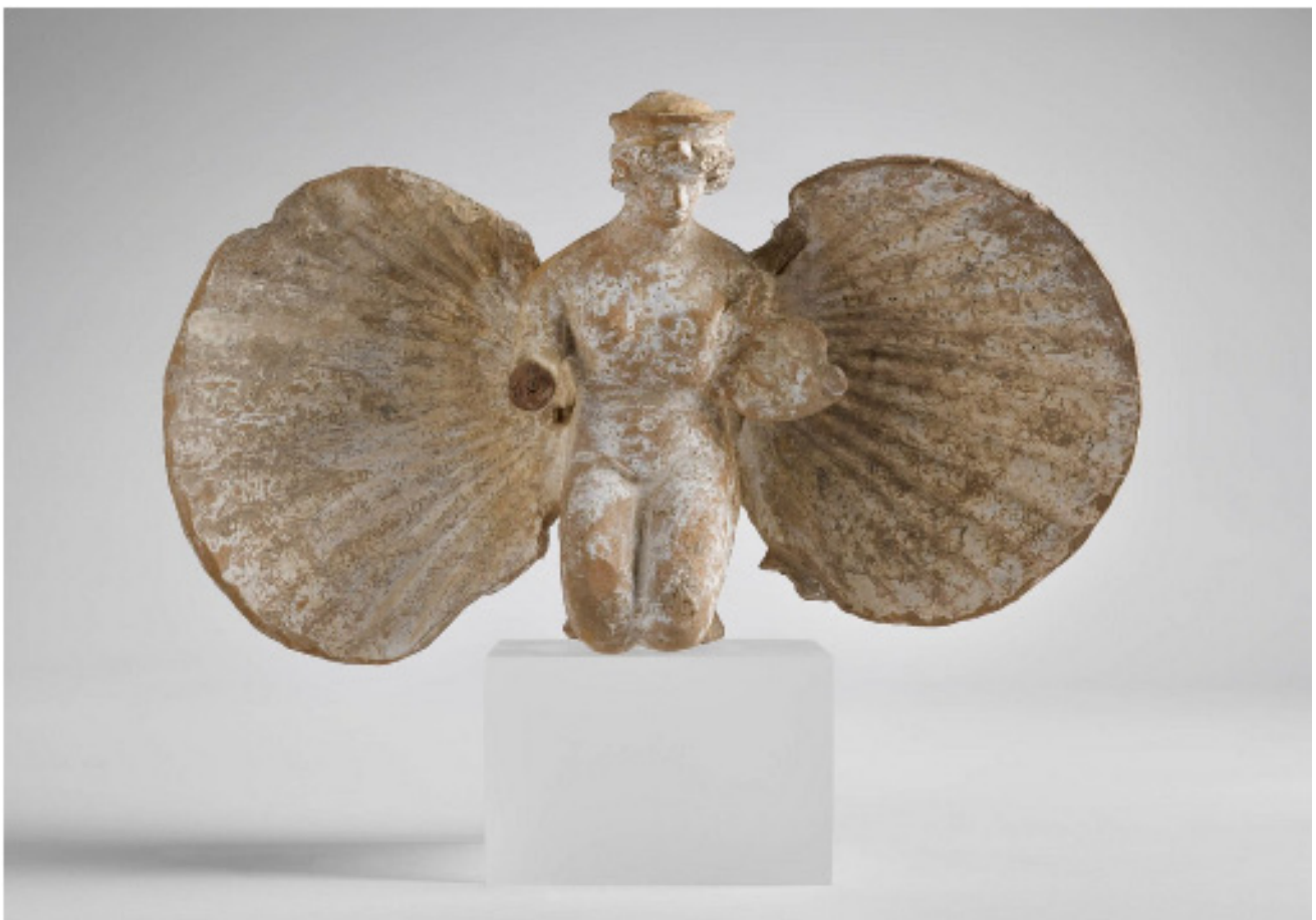
Vénus à la coquille, Premier quart du III ème siècle av. JC

Maria Thereza Alves et Jimmie Durham ont vécu à Marseille et à Rome avant de poser leurs valises à Naples. Ensemble, ils ont exploré les richesses de la mer Méditerranée. Ils présentent le fruit de leur collecte à Villeurbanne : textes, végétaux et objets archéologiques dressent le portrait sensible du berceau de l'humanité.