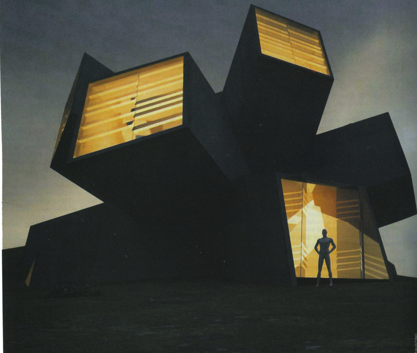
Solo House de Didier Faustino, en Espagne. Une maison d'« auteur » qui sera livrée en 2013.