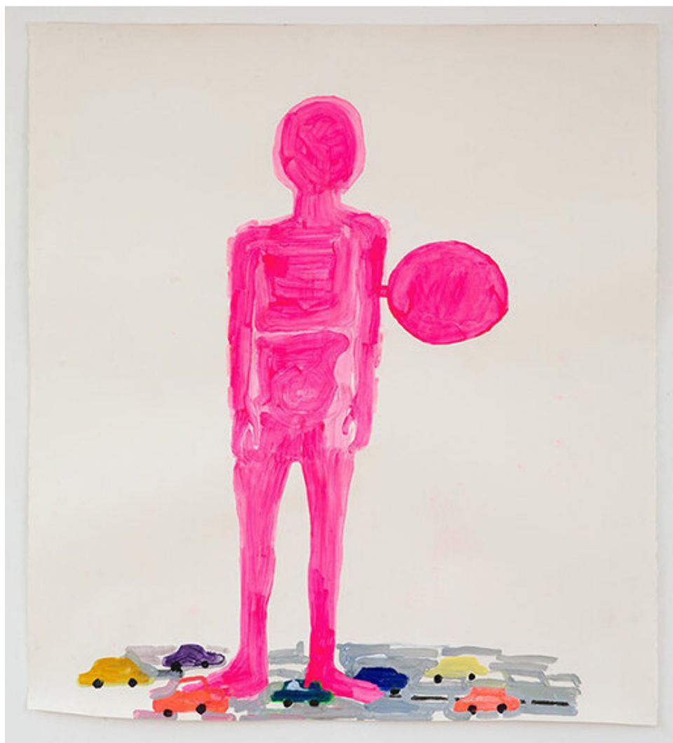
Anne-Marie Schneider, Untitled (personnage, automaaton, cars) , 2019, acrylic, pigments on paper, 128 x 114 cm

Une créature colossale rose bonbon à la fois bienveillante et menaçante... On ne peut s'empêcher d'imaginer, qu'une fois sa clé dans le dos remontée, elle sème le chaos et écrase les voitures jonchées à ses pieds.