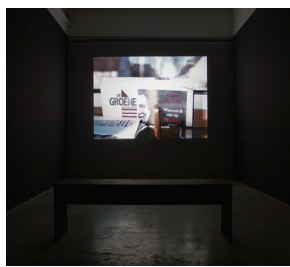
Allan Sekula, « Fish Story, Chapter 8 : Walking on Water », 1989-1995. Projection de slides.

« Fish Story – Chapter 8 : Dismal Science », 1989-92