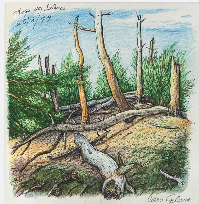
Plage des Salures , 2019 drawing on paper framed under glass dessin sur papier encadré sous verre 20,9 x 20,6 cm Frame : 41 x 31 cm unique artwork GILA20080