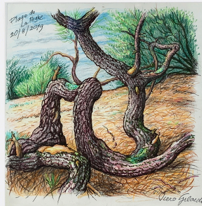
Plage de la Peghe , 2019 drawing on paper framed under glass dessin sur papier encadré sous verre 20,9 x 20,6 cm Frame : 41 x 31 cm unique artwork GILA20079