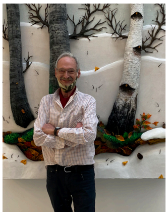
Piero Gilardi (1942-2023).

He produced his first nature- carpets (tappeti-natura) using polyurethane foam, and showed them at the Sperone gallery (Turin) in 1966, then in 1967 at the Sonnabend gallery (Paris) and the Fischbach gallery (New York). In 1968, he ceased producing artworks and embarked on a career as an art critic, becoming the correspondent for the magazine Flash Art. Travelling around Europe and the United States, he introduced Italy to the works of Richard Long, Eva Hesse, Jan Dibbets, and Bruce Nauman, and helped put on two major international shows: When Attitudes Become Form (Bern, 1969) and Op Losse Schroeven (Amsterdam, 1969), which both presented the art tendencies of the moment (Arte Povera, Land Art, Antiform Art).