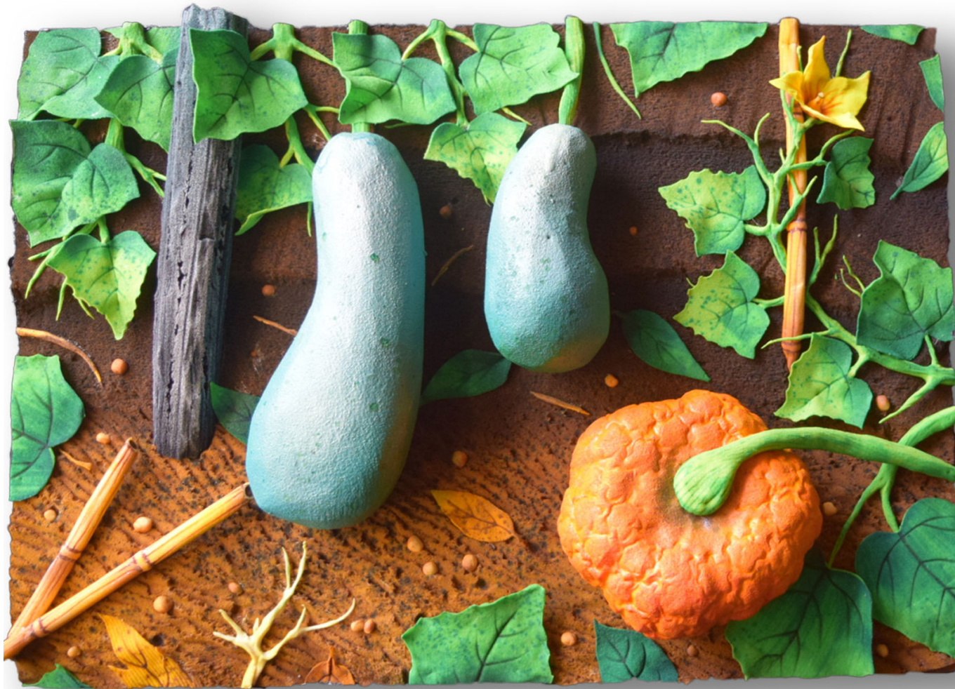
Zuccaia , 2021 polyurethane foam under plexiglas cover mousse polyuréthane, sous capot plexiglas 50 x 70 cm unique artwork GILA22107