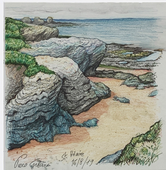
St Hilaire 1 , 2019 drawing on paper framed under glass dessin sur papier encadré sous verre 20,9 x 20,6 cm Frame : 41 x 31 cm unique artwork GILA20075