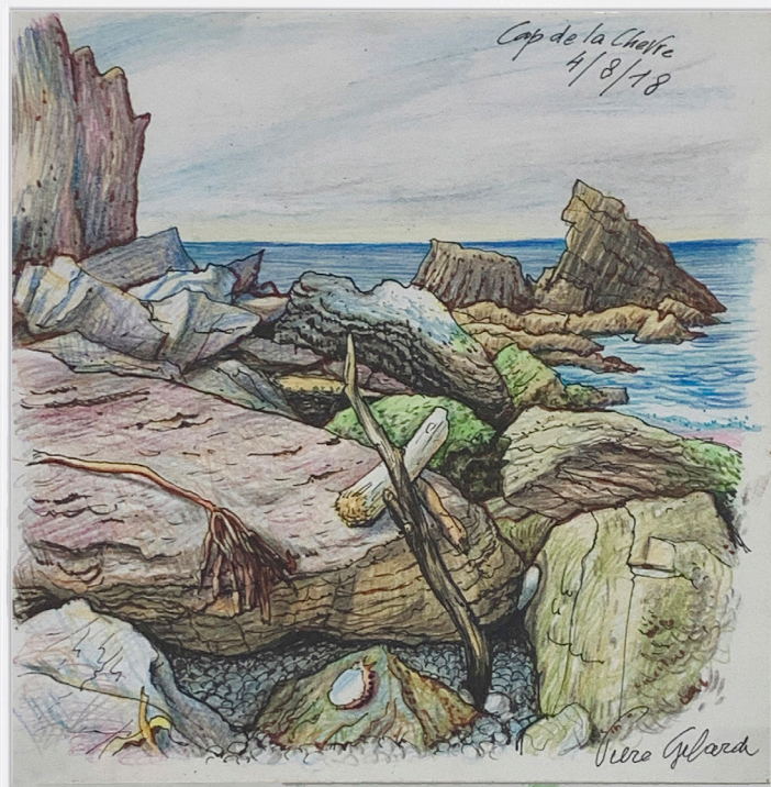
Cap de la chevre , 2018 drawing on paper framed under glass dessin sur papier encadré sous verre 20,4 x 19,8 cm Frame: 41 x 31 cm unique artwork GILA20074