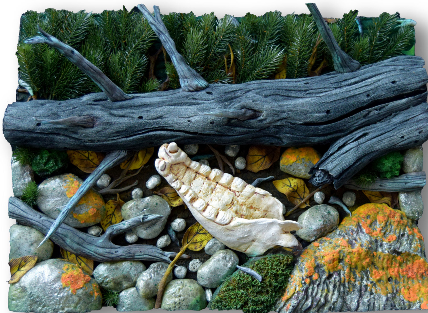
Bosco dei cervi , 2021 polyurethane foam under plexiglas cover mousse polyuréthane, sous capot plexiglas 50 x 70 cm unique artwork GILA22108