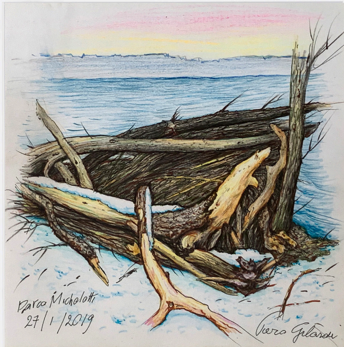
Parco Michelotti , 2019 drawing on paper framed under glass dessin sur papier encadré sous verre 20,4 x 20,2 cm Frame : 41 x 31 cm unique artwork GILA20078