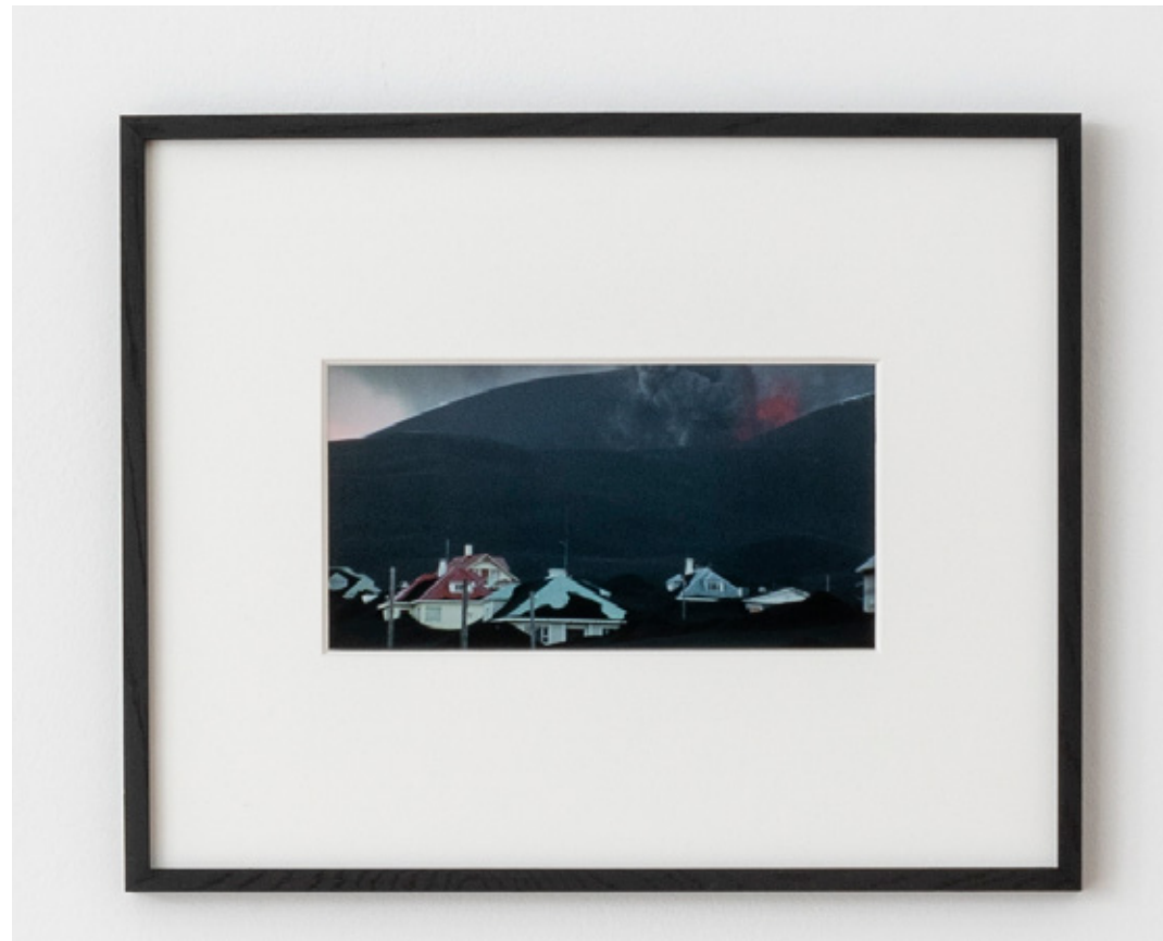
Etude pour une catastrophe #2 , 2019 tirage lambda, cadre bois, verre lambda print, wooden frame, glass 42 x 52 x 2 cm (16.54 x 20.47 x 0.79 in.) Ed. de 6 ex + 2 AP SARI19093