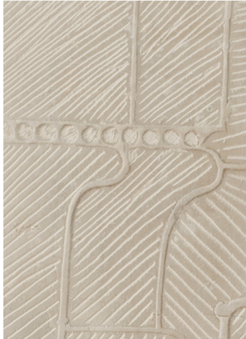
Sans titre - Untitled, 2019