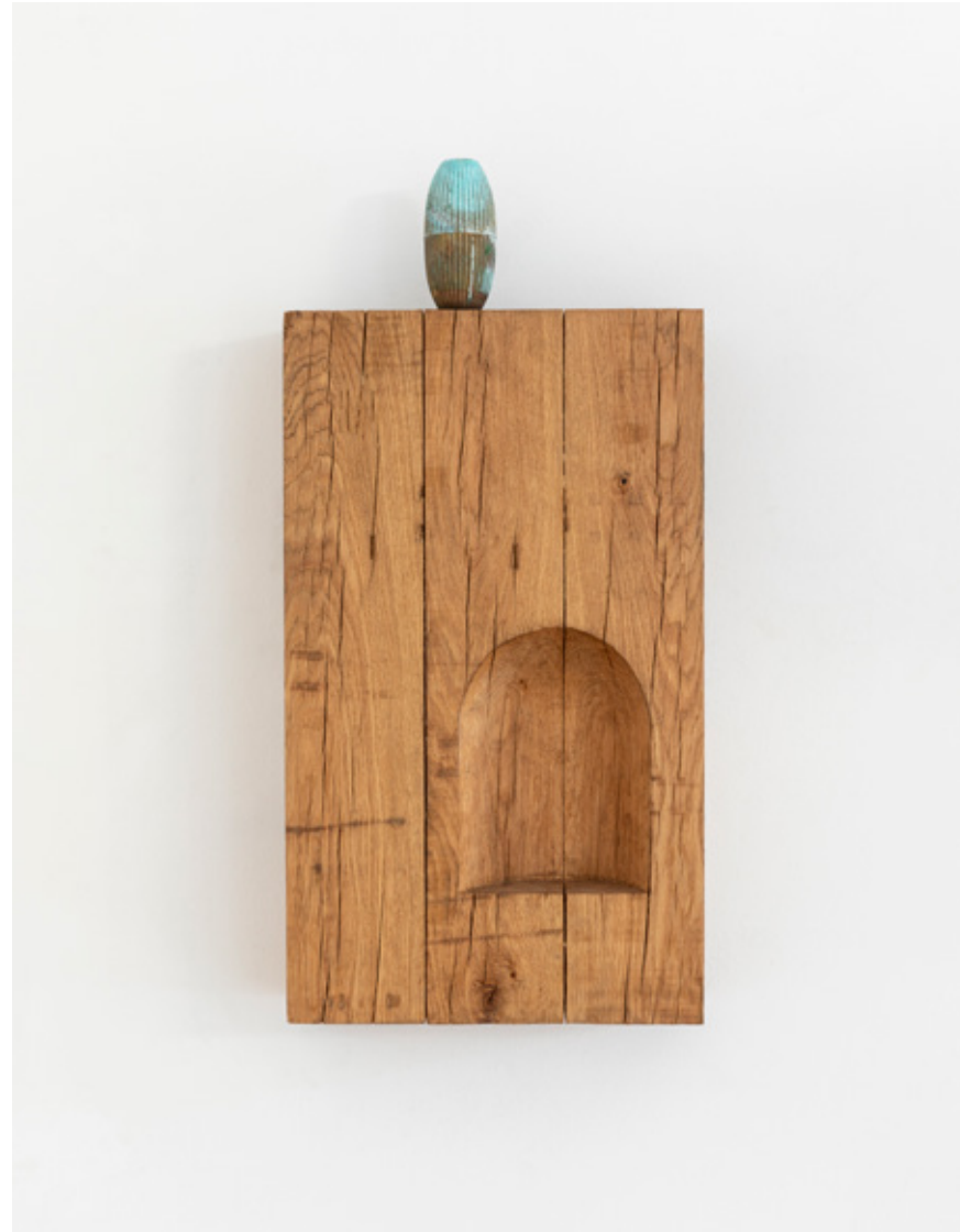
Variation sur celui du Lararium, numéro 2, 2019