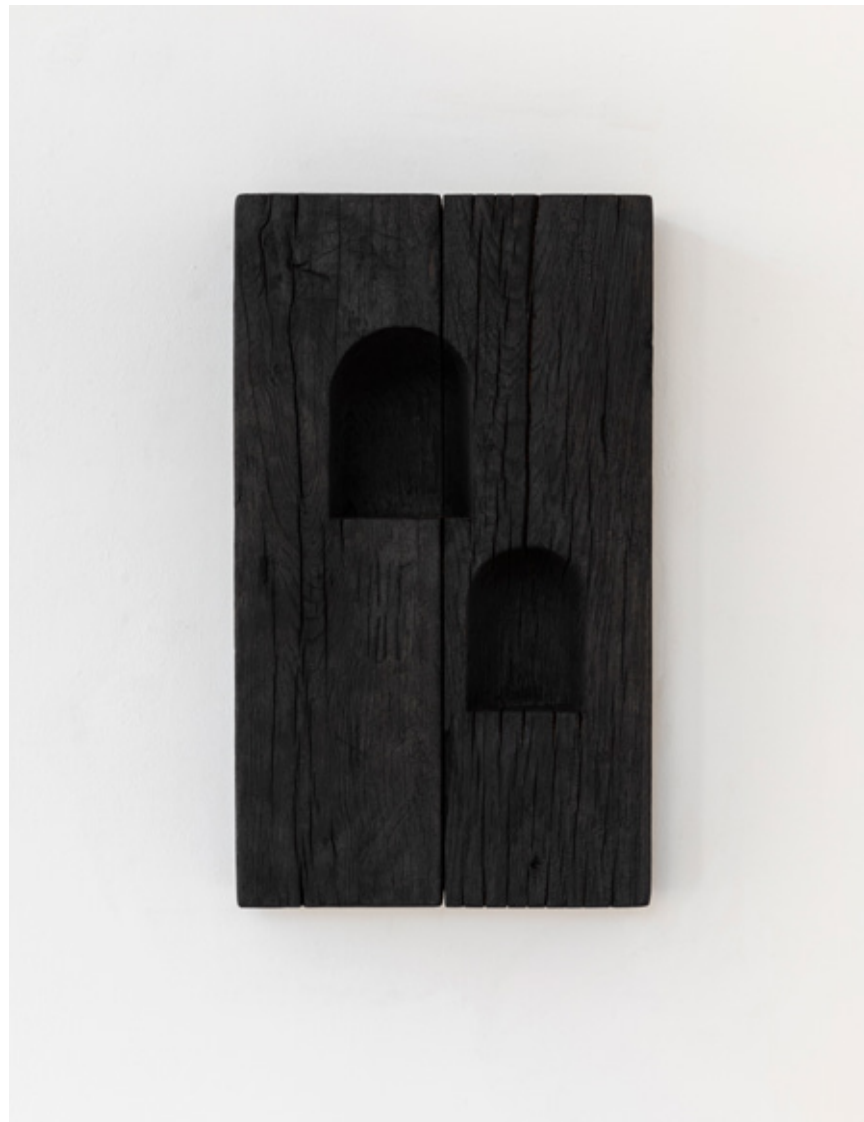
Variation sur celui du Lararium, numéro 3, 2019