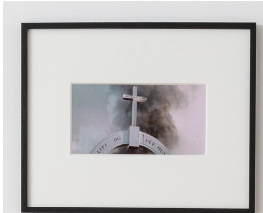
Etude pour une catastrophe #5 , 2019 tirage lambda, cadre bois, verre lambda print, wooden frame, glass 42 x 52 x 2 cm (16.54 x 20.47 x 0.79 in.) Ed. de 6 ex + 2 AP SARI19096