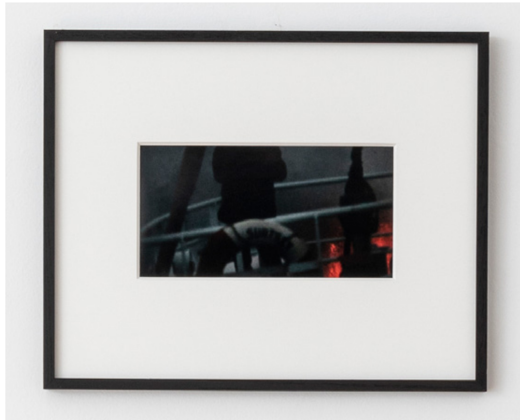
Etude pour une catastrophe #3 , 2019 tirage lambda, cadre bois, verre lambda print, wooden frame, glass 42 x 52 x 2 cm (16.54 x 20.47 x 0.79 in.) Ed. de 6 ex + 2 AP SARI19094