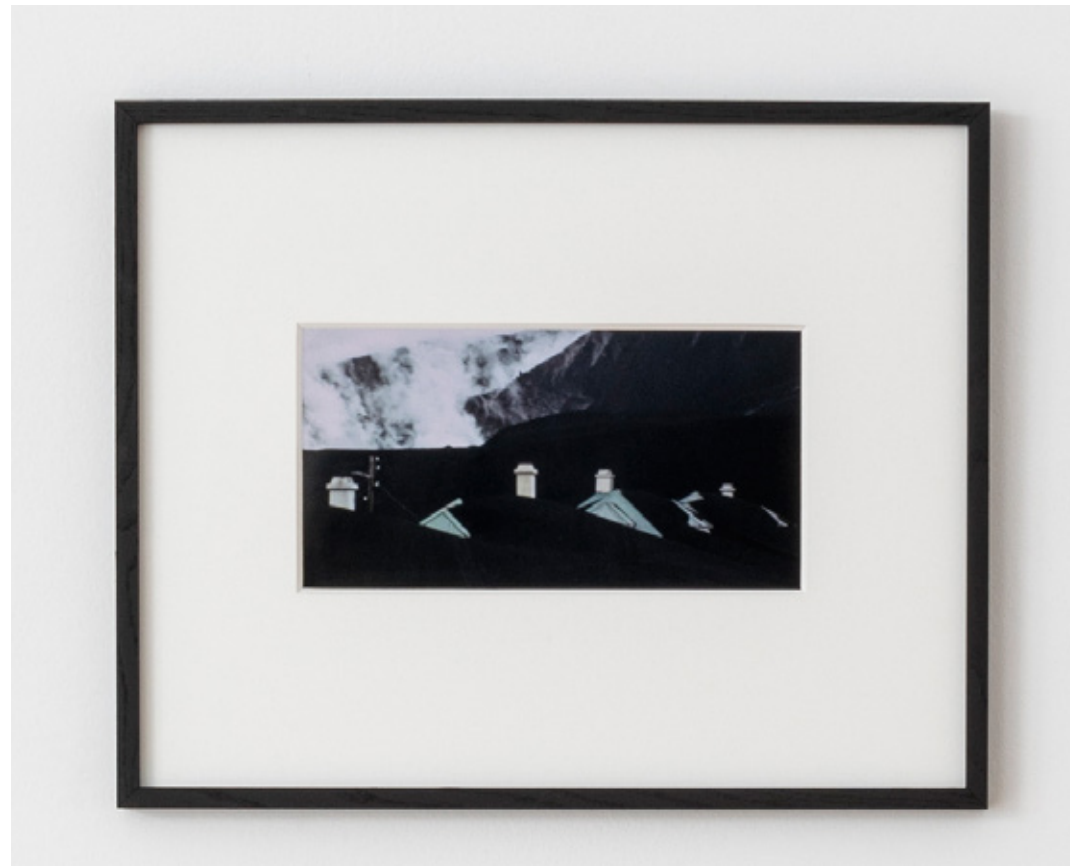
Etude pour une catastrophe #1 , 2019 tirage lambda, cadre bois, verre lambda print, wooden frame, glass 42 x 52 x 2 cm (16.54 x 20.47 x 0.79 in.) Ed. de 6 ex + 2 AP SARI19092