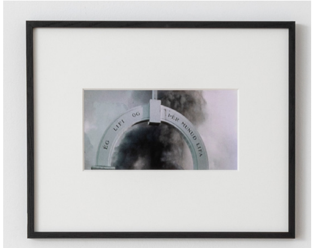
Etude pour une catastrophe #4 , 2019 tirage lambda, cadre bois, verre lambda print, wooden frame, glass 42 x 52 x 2 cm (16.54 x 20.47 x 0.79 in.) Ed. de 6 ex + 2 AP SARI19095