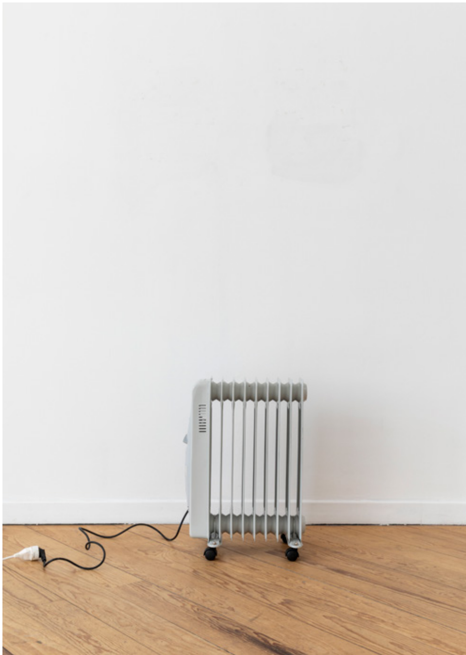
Radiateur , 2019 radiateur, rallonge radiator, extension 62 x 39,5 x 25 cm (24.41 x 15.35 x 9.84 in.) SARI19104