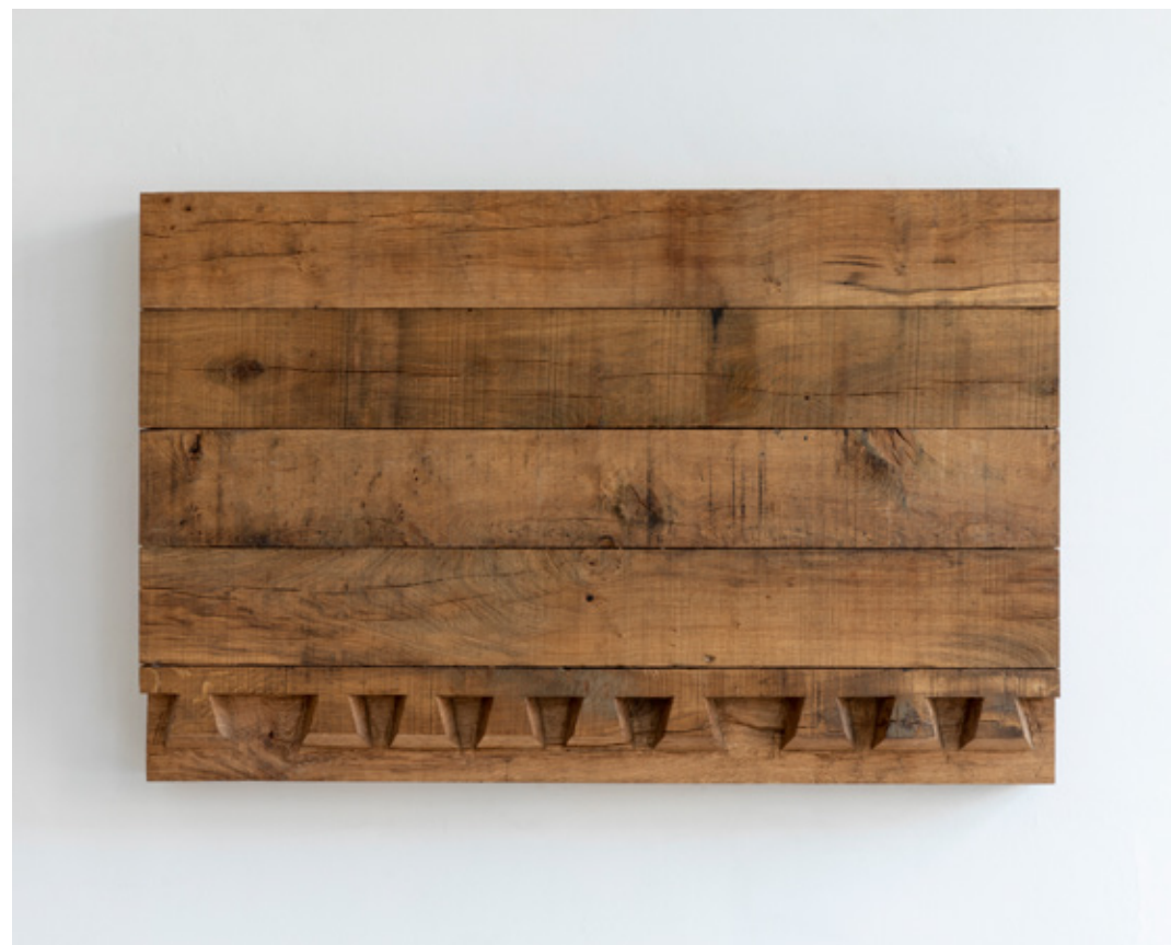
Variation sur celui du Triglyphe, numéro 6, 2019 chêne massif massive oak 75,5 x 116,5 x 15 cm (29.53 x 45.67 x 5.91 in.) SARI19098