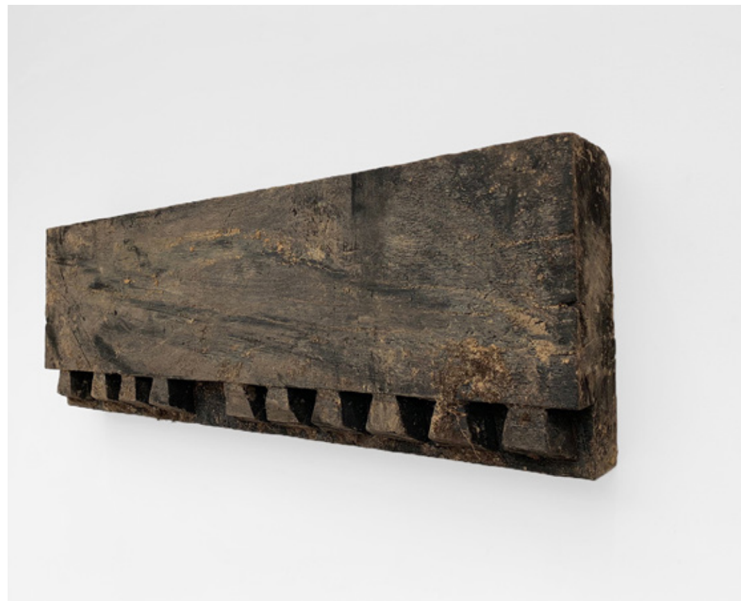
Variation sur celui du Triglyphe, numéro 4, 2019 chêne massif brûlé, terre massive burned oak, ground 40,5 x 123 x 14 cm (15.75 x 48.43 x 5.51 in.) SARI19099