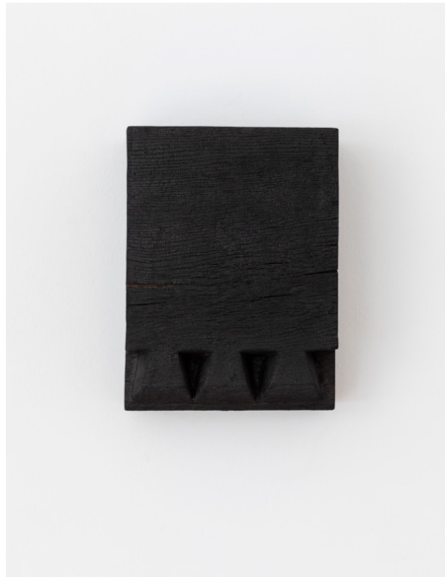
Variation sur celui du Triglyphe, numéro 1, 2019 chêne massif brûlé massive burned oak 40,5 x 30 x 13,5 cm (15.75 x 11.81 x 5.12 in.) SARI19102