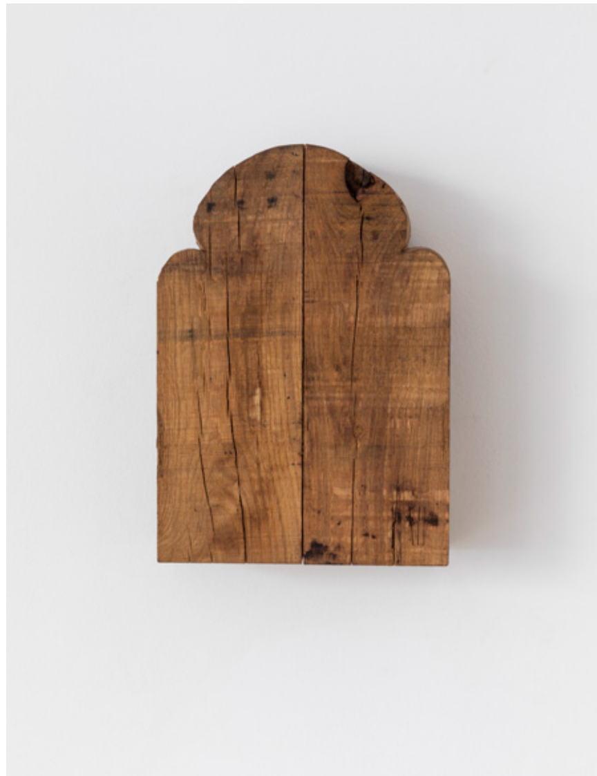
Retable , 2019 chêne massif massive oak 43,5 x 30,5 x 15 cm (16.93 x 11.81 x 5.91 in.) SARI19101