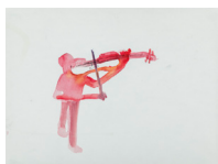
Sans titre - Untitled (violoniste - violonist) , 2018 aquarelle, cadre bois, plexiglas 36,7 x 46,6 x 3,9 cm