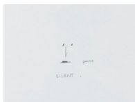
Le silence , 2018 crayon sur papier, cadre bois, plexiglas 48,5 x 36,5 x 3,9 cm