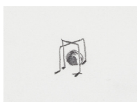
Sans titre - Untitled (notes de musiques - musical note) , 2018 crayon sur papier, cadre bois, plexiglas 37,5 x 29,8 x 3,9 cm