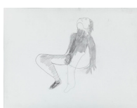
Sans titre - Untitled (nu - naked) , 2018 crayon sur papier, cadre bois, plexiglas 48,5 x 36,5 x 3,9 cm