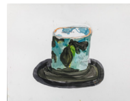
Groenland , 2018 aquarelle et encre de chine, cadre bois, plexiglas 53 x 68 x 3,9 cm