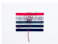
La note rose , 2018 bois, pigments, liant, câble électrique 33,5 x 35 x 8 cm