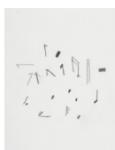
Sans titre - Untitled (notes de musiques - musical note) , 2018 crayon sur papier, cadre bois, plexiglas 37,5 x 29,8 x 3,9 cm