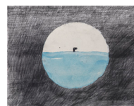
Untitled , 2018 collage, gouache, aquarelle et crayon sur papier 60,7 x 45,9 cm