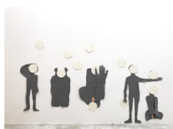
Le silence , 2018 feutrine, papier aquarelle, coton-lin 280 x 485 cm