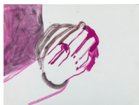
Sans titre - Untitled (mains de violoniste - violinist hands) , 2018 aquarelle et encre de chine, cadre bois, plexiglas 36,7 x 46,6 x 3,9 cm