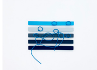
La note bleue , 2018 bois, pigments, liant, câble électrique 33,5 x 34 x 12 cm