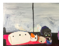
Sans titre - Untitled (bon-homme de neige - snowman) , 2018 acrylique sur toile 64,5 x 81 cm