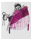
Sans titre - Untitled (violoniste royal - royal violinist) , 2018 aquarelle et encre de chine, cadre bois, plexiglas 36,7 x 46,6 x 3,9 cm