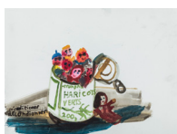
Sans titre (déconditionner) , 2018 aquarelle, encre de chine, cadre bois, plexiglas 40,5 x 50,5 x 3,9 cm