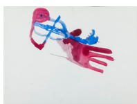
Sans titre - Untitled (violoniste - violonist) , 2018 aquarelle, cadre bois, plexiglas 36,7 x 46,6 x 3,9 cm