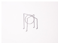
Sans titre - Untitled (notes de musiques - musical note) , 2018 crayon sur papier, cadre bois, plexiglas 37,5 x 29,8 x 3,9 cm