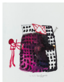
Sans titre - Untitled (violoniste royal - royal violinist) , 2018 aquarelle et encre de chine, cadre bois, plexiglas 36,7 x 46,6 x 3,9 cm