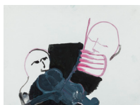
Sans titre - Untitled (violonistes - violonists) , 2018 aquarelle et encre de chine, cadre bois, plexiglas 36,7 x 46,6 x 3,9 cm